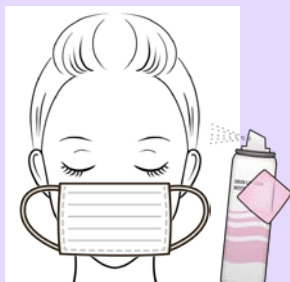
メイク+スプレー(試験品) +マスク